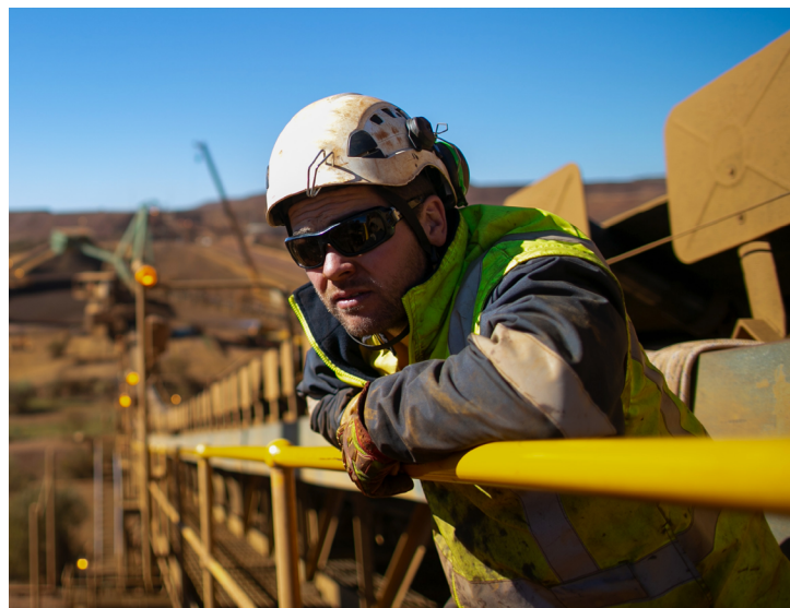
Tabla 1-Categorías de Filtros de Oscuridad del Lente para Protección contra la Energía Radiante

Para una protección adecuada de la luz que es producida por el uso de láseres, soldadura u otros trabajos que requieren estar expuestos a energía radiante, OSHA recomienda usar lentes con filtros para trabajos específicos: