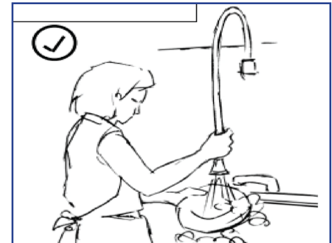
Ejemplo de postura mejorada de hombros y muñecas.