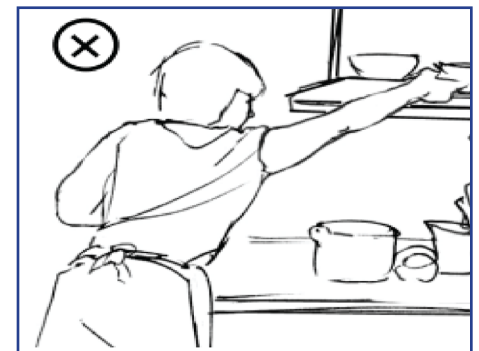
Ejemplo de postura incómoda de espalda, hombros y muñeca.